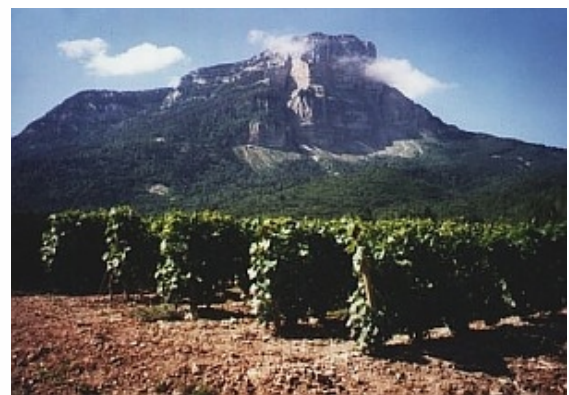
Le Mont Granier