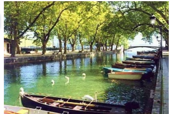
Le lac d'annecy